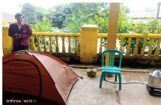
Gambar 1. Konsep sauna rempah nusantara

Pengambilan data yang disiapkan adalah jumlah warga yang hadir, jumlah warga yang diukur TTV (tanda-tanda vital) sebelum dan setelah masuk ke bilik sauna, respon masyarakat terhadap sauna rempah nusantara.