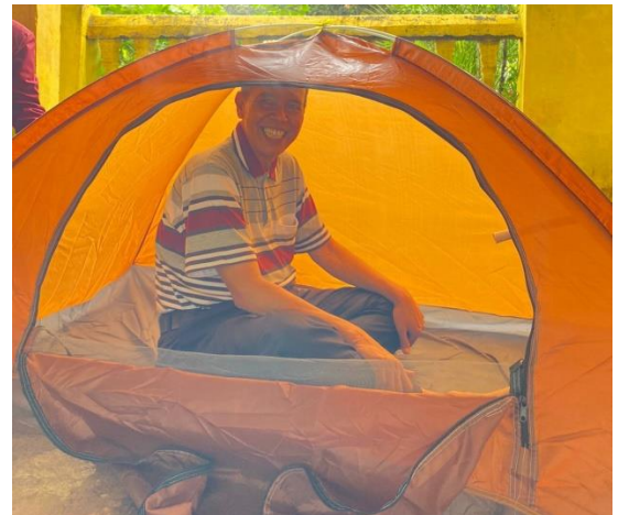
Gambar 3. Masyarakat masuk ke dalam bilik sauna

Praktek pengabdian sauna rempah nusantara adalah 1 warga masuk ke dalam bilik sauna selama 10-15 menit. Sebelum dan sesudah masuk bilik sauna, warga dilakukan pengukuran TTV (tanda-tanda vital), sehingga terlihat perbedaannya saat melakukan proses mandi uap. Dari Tabel 1. Dapat dijelaskan bahwa jumlah warga yang hadir sebanyak 23 orang. Warga yang melakukan TTV sebelum masuk bilik sauna sebanyak 23 orang. Namun, warga yang melakukan TTV sesudah masuk bilik sauna sebanyak 9 orang.