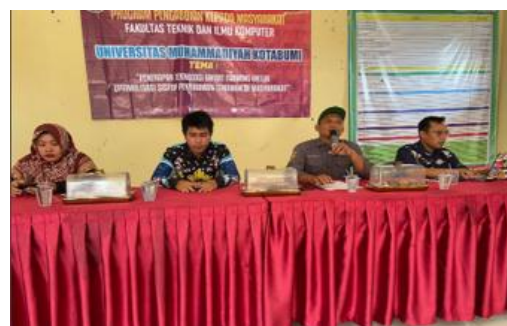
Gambar 2 Sambutan Kepala Desa

pengabdian yang telah memilih Desa Sawojajar sebagai lokasi pelatihan.