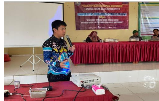
Gambar 5 Paparan Materi oleh Narasumber

Dalam sesi ini, narasumber memberikan pengantar tentang konsep IoT, komponen utamanya (sensor, aktuator, mikrokontroler, dan koneksi internet), serta cara kerja sistem penyiraman otomatis. Peserta terlihat antusias, terutama saat melihat contoh kasus penggunaan IoT dalam bidang pertanian. Narasumber juga memaparkan keuntungan menggunakan aplikasi berbasis android untuk memantau dan mengontrol sistem penyiraman dari jarak jauh.