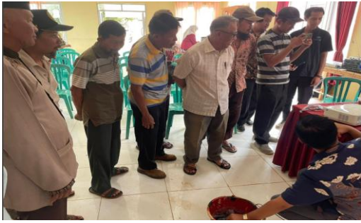
Gambar 6 Demonstrasi Alat IoT