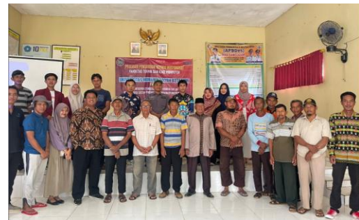
Gambar 8 Dokumentasi Tim PkM dan Peserta

Acara ditutup dengan ucapan terima kasih dari panitia kepada seluruh peserta yang telah berpartisipasi aktif. Foto bersama menjadi momen penutup yang mengabadikan semangat kolaborasi antara tim pengabdian dan masyarakat Desa Sawojajar.