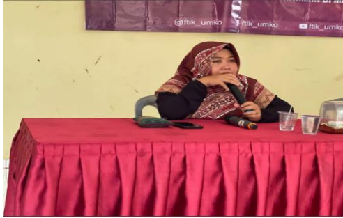
Gambar 3 Sambutan Dekan FTIK

merupakan salah satu bagian dari Caturdarma Dosen dan dilakukan secara berkelanjutan.