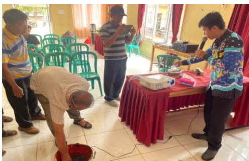
Gambar 7 Uji Alat oleh Peserta

Beberapa peserta diberikan kesempatan mempraktikkan perakitan sistem penyiraman otomatis didampingi oleh tim pengabdian untuk memastikan peserta memahami proses pemasangan sensor, pengaturan mikrokontroler, dan koneksi ke aplikasi android . Meskipun ada peserta mengalami kesulitan awal, pada akhirnya peserta berhasil merakit sistem dan mengujinya dengan sukses.