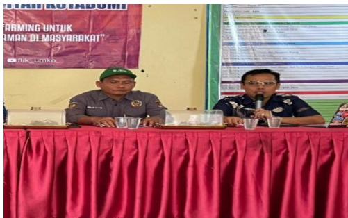
Gambar 4 Pemaparan Tujuan dan Manfaat oleh Ketua Tim PkM

Ketua dari Tim pengabdian menjelaskan tujuan utama pelatihan, yaitu memperkenalkan teknologi IoT yang dapat meningkatkan efisiensi dan produktivitas sektor pertanian. Dalam sesi ini, peserta diharapkan memahami bahwa teknologi IoT dapat membantu mengoptimalkan penyiraman tanaman berdasarkan kebutuhan, sehingga dapat menghemat air dan tenaga kerja.